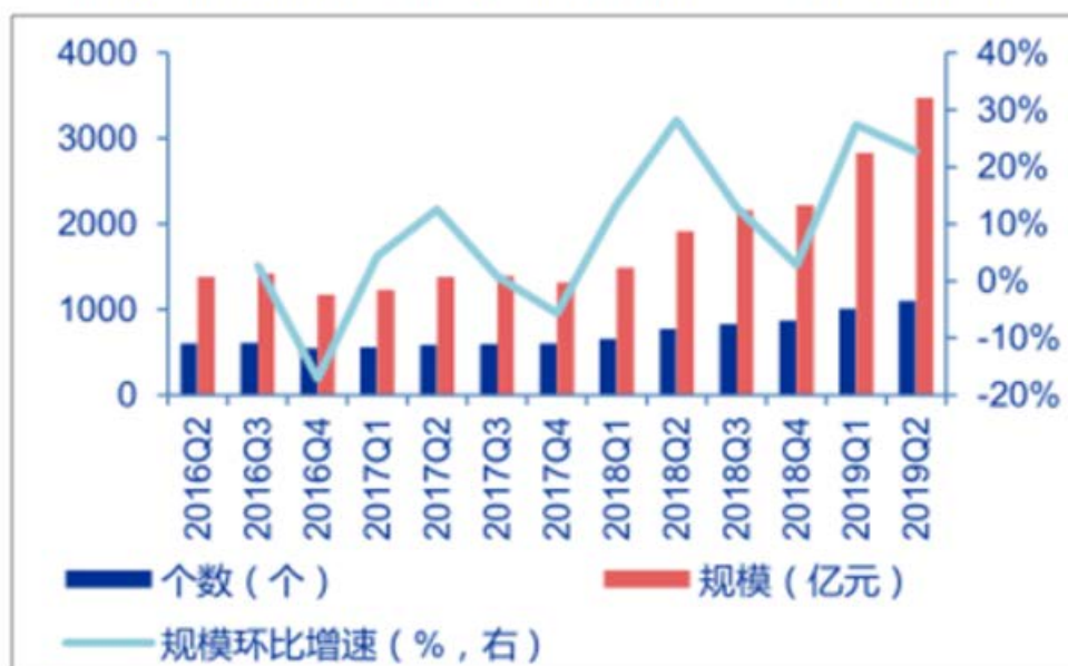
2016Q2-2019Q2信托行业风险项目和规模趋势（个，亿元，%）

4.4.7. 据统计 36 ，2018 年银行的不良贷款约为 2 万亿元，而 2019 年约为 2.4 万亿元，增长近 4,000 亿元，年增长率为 19.16%。而全国 2019 年各银行以债权转让方式成交的不良贷款总额为 3,962 亿元，即实际上全国银行业全年新形成不良贷款 7,843 亿元。全国银行业 2019 年正常和关注类贷款总额为 127.2 万亿元，较 2018 年底的 108.5 万亿元，增加了 18.7 万亿元，新增不良贷款与新增非不良贷款的比例为 0.04:1，反映出银行的贷款资产质量未见好转。而受新型冠状病毒疫情影响，预料贷款不良率将继续攀升，这说明银行的不良贷款存货仍在快速攀升，市场供应充足。